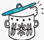
warsztaty kulinarne cooking workshops