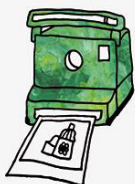
wystawa fotograficzna photo exhibition