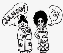
warsztaty językowe language workshops

The largest multicultural event in Krakow